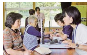
地域コミュニティ活動支援(介護予防・健康講座/滝沢村)