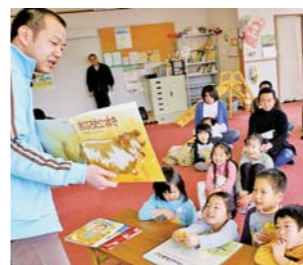
子育て支援隊(パパ向け講座/宮古市)