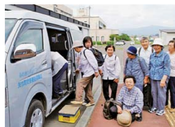
地域福祉活動に使用する車両の整備 (ふれあいサロン/矢巾町)