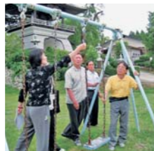
安全・安心と子育て支援 (子どもの遊び場整備/奥州市)

赤い羽根共同募金運動(10月1日～12月31日までの3カ月間)は、県民の皆さまの理解と協力、そして多くの募金ボランティアの支援で、民間の社会福祉事業や地域福祉の向上に大きな役割を果たしています。今年も「地域をつくる住民を応援する共同募金」として、地域の皆さまと一緒に運動を進め、あなたの募金を「あなたのまちの福祉」に役立てます。