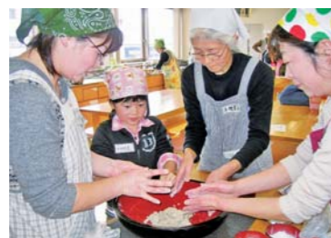
世代間交流(そば打ち講習会/盛岡市)